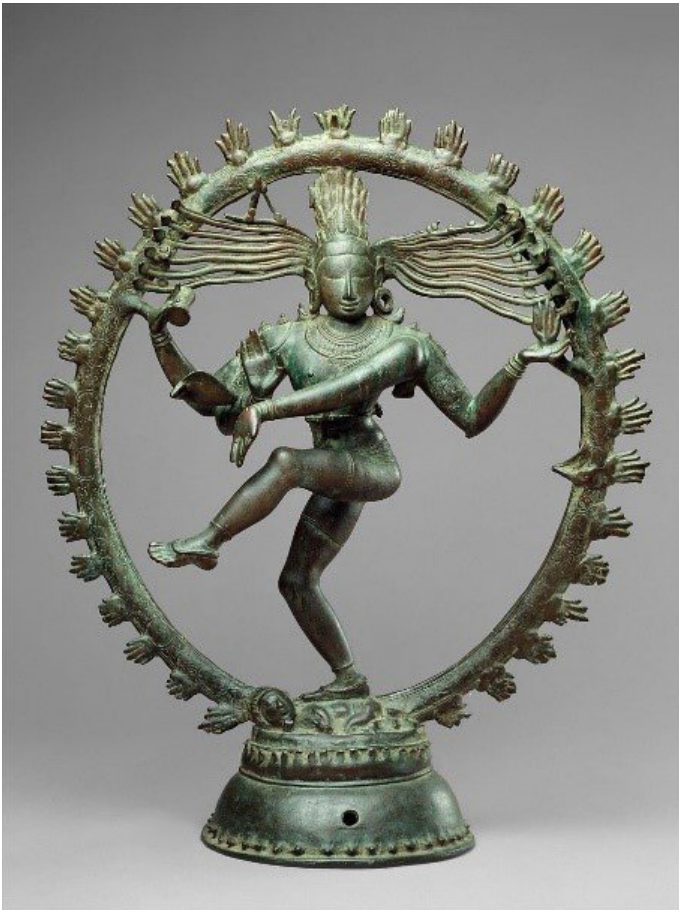
Der tanzende Shiva hat offensichtlich überall seine Finger im Spiel

Leicht könnte man auf die Idee verfallen, die Lehre von Joseph Schumpeter, wonach in der Wirtschaft sich alles um kreative Zerstörung (modisch formuliert: „Disruption“) oder die Erhaltung von Mono- oder Oligopolen drehe, sei nichts als eine Profanisierung der Shiva-Lehre. Wenn das so wäre, würde Shiva sich im gegenwärtigen Marktumfeld gewiss wohlfühlen. Es entsteht viel, es wird aber auch viel zerstört, die Zeit scheint schneller abzulaufen als gewöhnlich. Die Digitalisierung immer weiterer Lebensbereiche (ja, liebe Lehrer, auch der Schule), die jedem wachen Beobachter schon länger unvermeidlich scheint, hat einen Schub erhalten, der sich auch in den Kursen von Amazon, Microsoft und Zoom ablesen lässt. Wie überflüssig viele Reisen, viele Autofahrten und Restaurantbesuche sind, hat sich während des Lockdowns schnell herumgesprochen und entsprechend sehen auch die Aktien von Branchen ohne echtes Zukunfts-